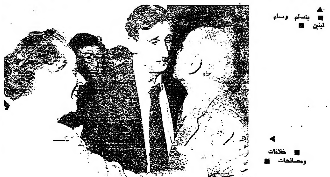
▲ ينسلم وسام لينين ■